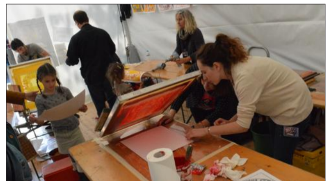
Atelier sérigraphie avec l'impression d'un jeu de l'oie qui retrace la conception d'un livre : de la page blanche à la dédicace.