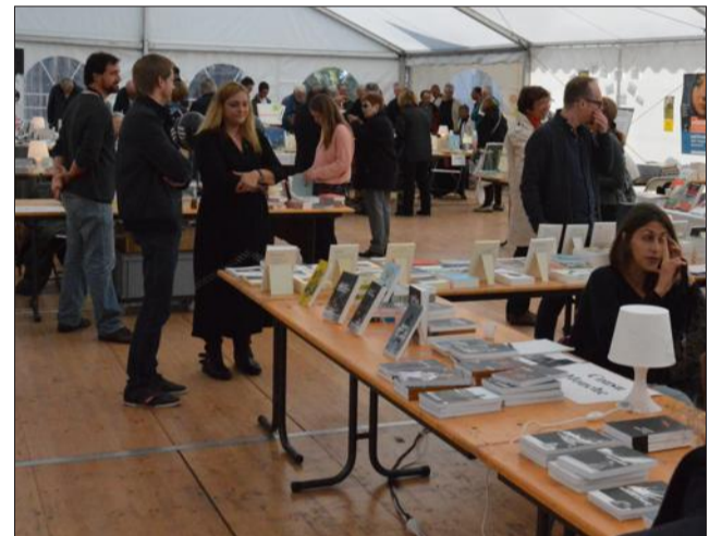
Éditeurs, libraires et auteurs étaient réunis sous le chapiteau chauffé, à côté du théâtre de la Comédie.