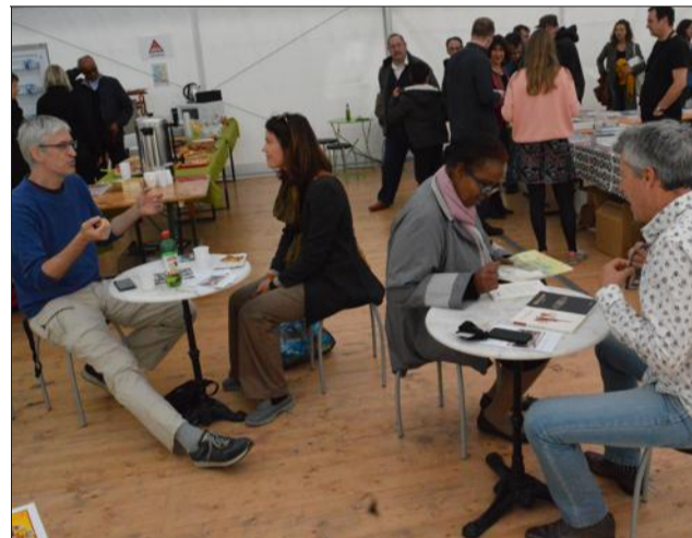
Auteurs et lecteurs avaient rendez-vous autour d'un café pour discuter littérature, sous la forme d'un speed dating.