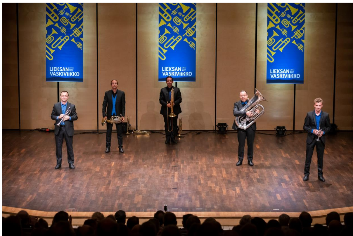
Concert au Centre culturel de Lieksa, le lieu central du festival