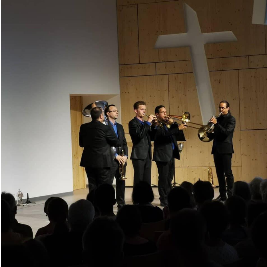
Le Concert de Montbéliard