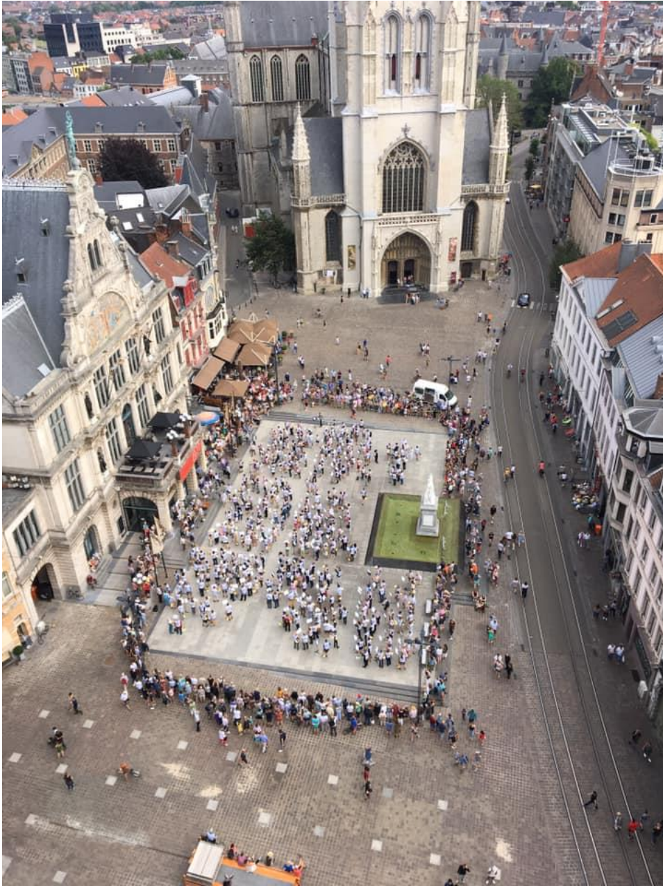
Le Record du Monde « Guinness Book » et les 402 cornistes....