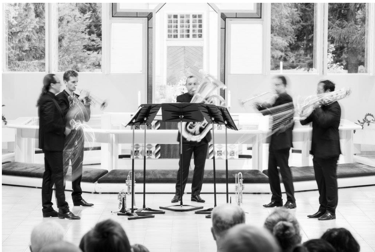
Les Variations Goldberg dans la Lieksan Kirkko