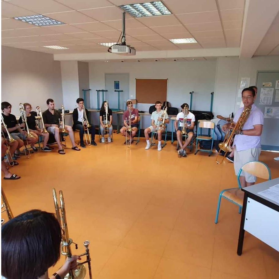
Masterclass à Eurocuivres.